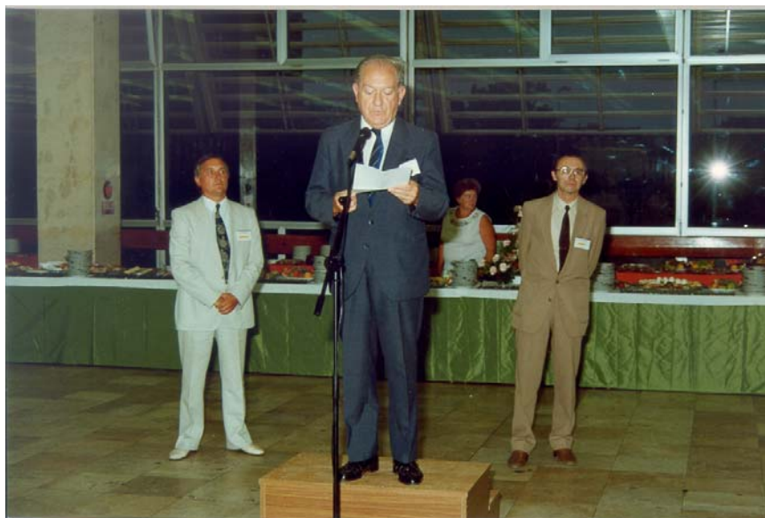
A fogadáson Michelberger Pál a Budapesti Műszaki Egyetem rektora mond Üdvözlőbeszédet

összefoglalója szerepelt, amelyekre 28 szekció keretében került sor. Az előadások teljes szövegét tartalmazó Proceedings 8 kötetben jelent meg, a szekció elnökök szerkesztésében [9].