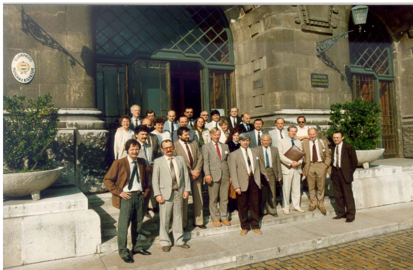
A résztvevők csoportja a Műegyetem főbejárata előtt